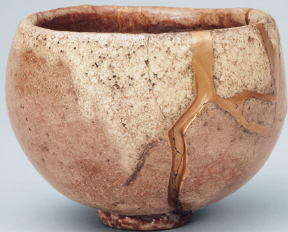
重要文化財 赤楽茶碗 銘 雪峯 本阿弥光悦 江戸時代 右:紅地金雲雪持椿模様唐織(部分) 江戸時代 [前期展示]

The Passage of the Seasons – Fine Pieces Representing “Splendor” and “Wabi”